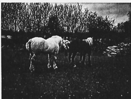
Photo 1. Saillie en main d'un couple de Percherons.

« flehmen ». La plupart des étalons interagissent avec une jument dès qu'on les y autorise. Ils parviennent à l'érection après deux minutes de contact et sont prêts à chevaucher 5 à 10 secondes après érection totale. Le comportement copulatoire de l'étalon comprend plusieurs étapes : chevauchement, intromission, « coups de reins », éjaculation, puis retrait. Une fois que le chevauchement a débuté, le comportement de l'étalon en main est identique à celui des étalons libres de n'importe quelle race. La plupart des étalons éjaculent après 6 à 8 « coups de reins ». Dans les haras bien organisés, la séquence de saillie complète, incluant le nettoyage du pénis, est réalisée dans la majorité des cas en une à deux minutes. Le comportement sexuel de l'étalon est remarquablement constant dans le temps lors de monte en main bien menée face à une jument