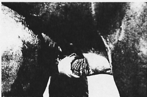
Photo 2. Collecte de sperme avec un vagin rigide de type «Colorado» qui présente l'avantage de pouvoir être utilisé ouvert ou fermé. Ouvert, il permet de visualiser les différentes phases d'émission du sperme et de ne collecter que la plus riche en spermatozoïdes.

boute-en-train. L'observation précise du comportement typique d'un étalon à la monte permet de détecter précocement d'éventuels troubles. Les éléments les plus utiles à prendre en considération sont :