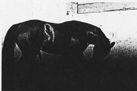
Photo 5. Chez l'étalon, les érections spontanées et régulières sont physiologiques. Abusivement appelées masturbations, ces manifestations constituent un comportement normal de l'étalon, au box comme en liberté.

comportement et s'avère utile dans environ la moitié des cas.