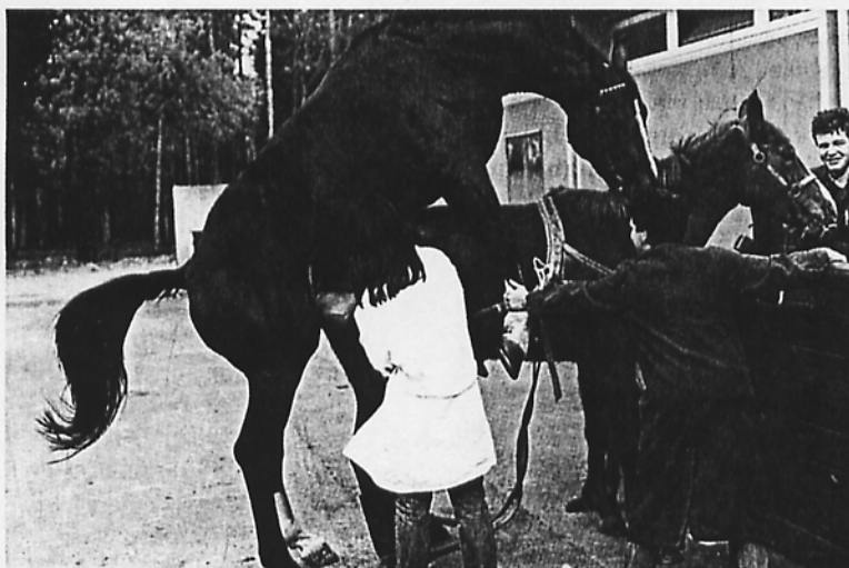
Photo 3. Collecte de sperme avec un vagin «souple» de type «Missouri». De l'eau chaude circule entre deux enveloppes de caoutchouc. L'ensemble est contenu dans une protection de cuir. Ce vagin ne permet des récoltes qu'à vagin fermé. Certains étalons préfèrent l'un ou l'autre type de vagin. Le changement de type de vagin peut permettre de maintenir l'intérêt sexuel de l'étalon.

La plupart des étalons s'habituent rapidement à la routine de monte à laquelle ils sont soumis : conditionnés, ils répondent à des stimuli associés à la monte en main et peuvent saillir avec un minimum ou sans stimulation. D'autres étalons, tout aussi normaux, sont plus exigeants et nécessitent une interaction prolongée avec la jument. Les étalons soumis à un protocole de monte très rigide peuvent devenir dépendants d'un rituel précis. Tout changement dans leur routine de reproduction vient alors perturber leur efficacité. La baisse de perfor-